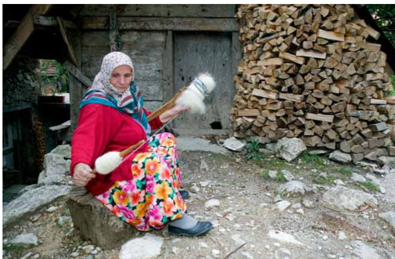
Bujqësia tradicionale ne fshatin Džajići (BH), foto: © WWF-Canon / E. Parker