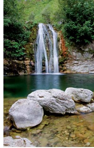
Crni vir (BH)

Projekti “Mjedisi për Njerëzit në Harkun Dinarik” (i njohur gjithashtu si “Mbështetje e Komuniteteve Rurale dhe Peisazheve të tyre Tradicionale përmes Përforsimit të Qeverisjes Mjedisore në zonat e Mbrojtura Ndërkufitare të Harkut Dinarik”) po zbatohet nga IUCN (Bashkimi Ndërkombëtar për Ruajtjen e Natyrës), WWF MedPO (Program Mesdhetar për Fondin e Kafshëve të Egra), SNV (dhe Organizata e Hollandeze për Zhvillim). Dhe është një projekt bashkëpunimi për zhvillim dhe mjedisor në Ballkanin Perëndimor financuar nga Ministria e Punëve të Jashtme të Finlandës.